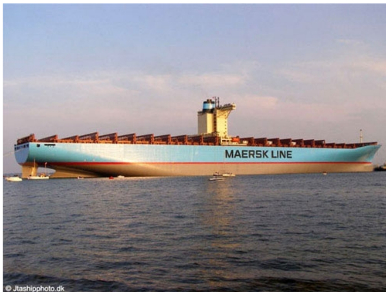
Tàu Emma Maersk có chiều dài 396,8m; chiều rộng 56,40m

Tàu Emma Maersk là tàu chở container lớn nhất thế giới hiện nay thuộc biên chế của Tập đoàn A.P. Moller-Maersk.